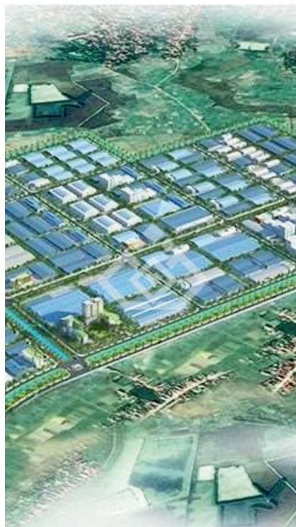
Hạ tầng khu công nghiệp Trần Đề Sóc Trăng