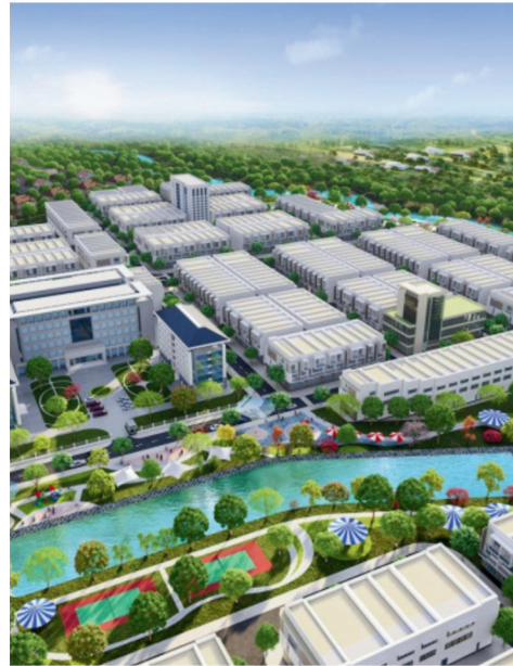
Dự án Khu dân cư Bù Na - Tỉnh Bình Phước