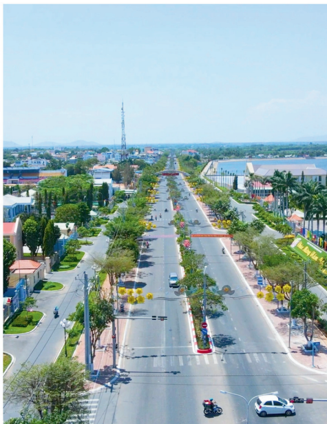
Dự án : Cải Tạo và mở rộng đường 27/4 Huyện Xuyên mộc,