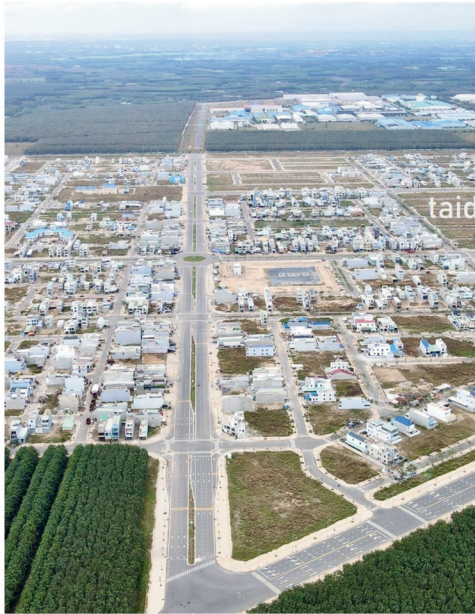
Khu tái Định Cư xã An Thạnh Tây, huyện Long Đức, Tỉnh Sóc Trăng