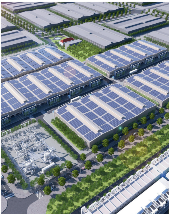
Dự án nhà xưởng cho thuê KCN Nhơn Trạch Đồng Nai ( IDICO Nhơn Trạch)