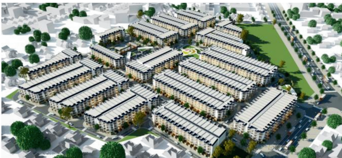
Khu nhà ở Xã Long Hội Huyện Nhơn Trạch Tỉnh Đồng Nai